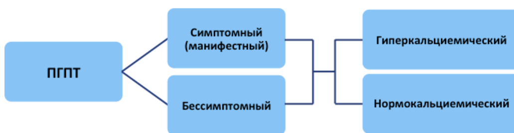
Рис.1 Классификация ПГПТ

Наиболее часто диагностируется гиперкальциемический вариант ПГПТ , характеризующийся повышением уровня кальция сыворотки крови в сочетании с повышенным (редко высоко-нормальным) уровнем ПТГ. Однако ПГПТ не всегда сопровождается повышением уровня кальция крови выше верхней границы референсного диапазона. Нормокальциемия может быть транзиторной при гиперкальциемическом варианте и стойкой при нормокальциемическом варианте заболевания. Нормокальциемический вариант ПГПТ (нПГПТ) характеризуется неизменно верхненормальным уровнем общего и ионизированного кальция в сыворотке крови в сочетании со стойким повышением уровня ПТГ, в отсутствии очевидных причин вторичного гиперпаратиреоза (дефицит витамина D, патология печени и почек, синдром мальабсорбции, гиперкальциурии и др.) [11, 17]. Классификация ПГПТ представлена на рис.1.